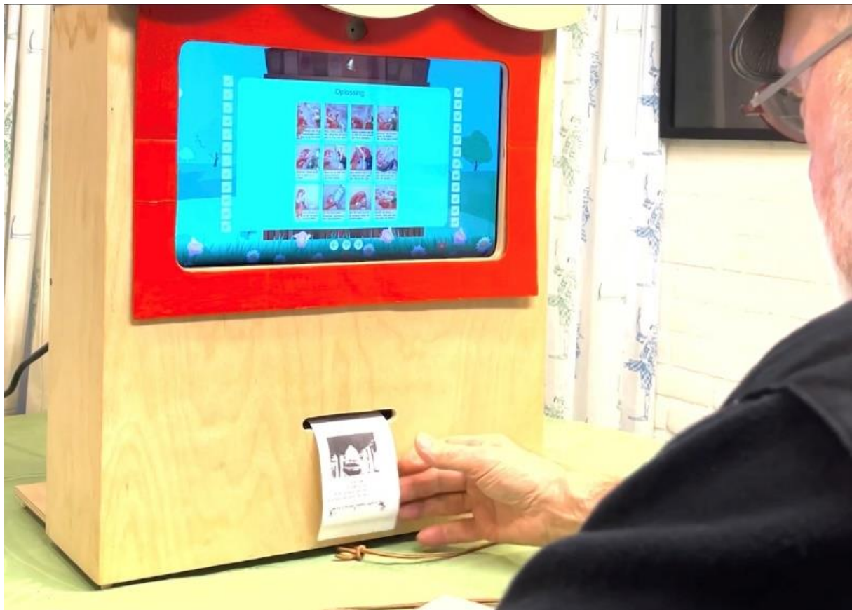
Afbeeldingen: voorplat – houten poppenkastje quiz offline met aanraakscherm, printsleuf en museumpet; aanraakscherm vraag 3 en ‘Oplossing’ met bon.