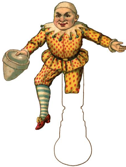
Amuseur public Internationaal. Clown. Papierentheaterfiguur.