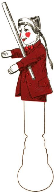
Guignol met een knuppel. Handpop uit Lyon.