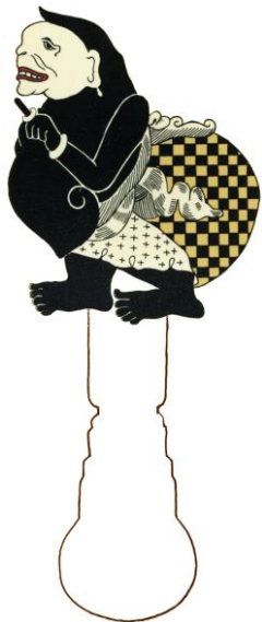
Semar Javaanse clown en schimfiguur uit Indonesië.