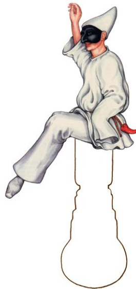
Pulcinella Gemaskerde nar uit de commedia dell'arte.