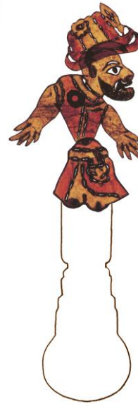
Karagöz Schimfiguur. Clown uit Turkije.