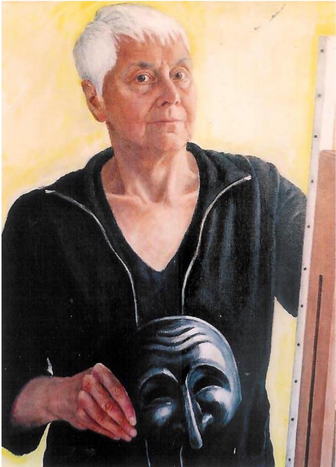
Zelfportret met Pulcinella-masker, acrylverf op doek (2008).

https://www.poppenspelmuseumbibliotheek.nl/pdf/Pamflet48ebijlage.pdf