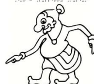
Wayang kulit Java Nala Gareng

Poppenspe(e)lmuseum / Dutch Puppetry Museum Poppenspe(e)lmuseum / Dutch Puppetry Museum