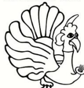
Wayang kulit Java Garuda

Poppenspe(e)lmuseum / Dutch Puppetry Museum Poppenspe(e)lmuseum / Dutch Puppetry Museum