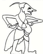
Wayang kulit Java Petruk

Poppenspe(e)lmuseum / Dutch Puppetry Museum Poppenspe(e)lmuseum / Dutch Puppetry Museum