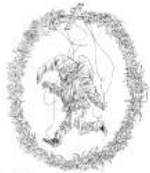
Wonderbaarlijke waar gebeurde ontsnapping van de heer P