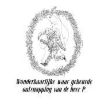
Wonderbaarlijke waar gebeurde ontsnapping van de heer P