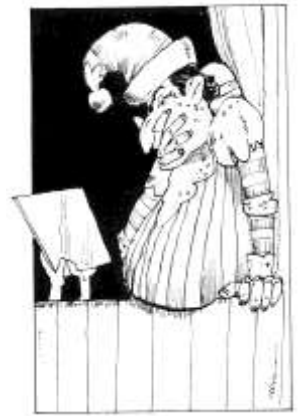
Afbeelding: Jan Klaassen een en al verbazing. Illustratie: Ad Swier (1985). Collectie Poppenspe(e)lmuseum.

Een korte vermelding van POPMUS is te vinden op de website van het TIN, de site van de NVP, de gids Nederland Museumland en in de Museumkijkwijzer/Museums-kompass: een gratis gids betreffende erfgoedinstellingen in Gelderland, Overijssel, Münsterland en Osnabrücker Land.