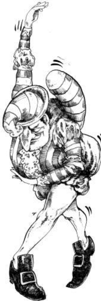
Afbeelding: buigende Jan Klaassen. Illustratie: Ad Swier (1985). Collectie: Poppenspe(e)lmuseum.

Jaarverslag 2011. POPMUS/OvdM (Vorchten, 24-01-2012).