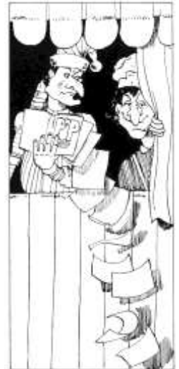
Afbeelding: Jan Klaassen, Katrijn en paperassen. Illustratie: Ad Swier (1985). Collectie: Poppenspe(e)lmuseum.

Het Poppenspe(e)lmuseum verworft, onderzoekt, ontsluit, beheert en presenteert materieel en immaterieel erfgoed op het gebied van het poppentheater in de ruimste zin van het woord, streeft naar bundeling van informatie en archivering op het gebied van het internationale poppen-, figuren- en objecttheater en biedt belangstellenden kennis van het verleden en inzicht in het heden.