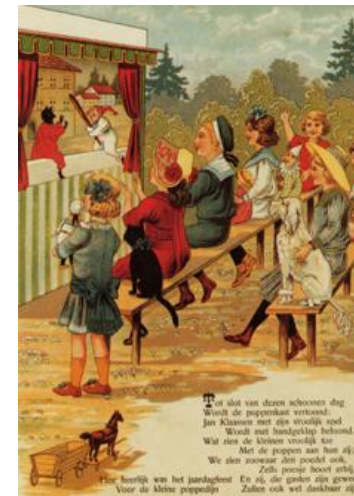
Afbeelding: poppenkastvoorstelling met Jan Klaassen in gevecht met de duivel. Pagina uit: 'Popjes verjaardag' (Nederland, omstreeks 1920). Stamboeknr.: 71.195. Briefkaartnr.: 89 025.

'Tot slot van dezen schoonen dag Wordt de poppenkast vertoond: Jan Klaassen met zijn vroolijk spel Wordt met handgeklap beloond. Wat zien de kleinen vroolijk toe Met de poppen aan hun zij; We zien zoowaar den poedel ook, Zelfs poesje hoort erbij. Hoe heerlijk was het jaardagfeest Voor de kleine poppedijn En zij, die gasten zijn geweest, Zullen ook wel dankbaar zijn.'