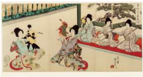
Illustratie: Bunraku- en Samisenspelers. Japans poppenspel. Chikanobu Yoshu (19 e eeuw).

Het verzamelbeleid zal zich de komende jaren voornamelijk richten op aankopen ten behoeve van de bibliotheekcollectie en de foto- en grafiekverzameling (met prenten uit het heden en het verleden) en enkele aankopen op het gebied van de wayang (Java en Bali) en de Bunraku (het Japanse poppentheater), het schimmenspel en voorwerpen/kunstobjecten van hedendaagse – aan het poppen- en objecttheater – gelieerde kunstenaars.