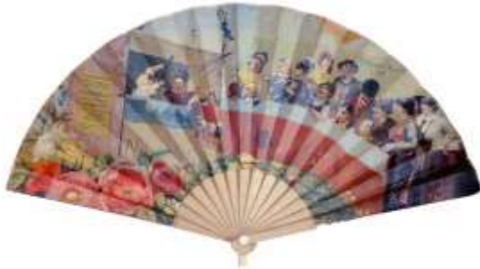
Illustratie: waaier. Aankondiging van poppenkastvoorstellingen met Pulcinella. Napels (begin 20 e eeuw).

Het museum wordt ondersteund door een kleine en hechte club 'Vrienden van het museum'. Zij zorgen voor de nodige hand- en spandiensten. Begunstigers van het Poppenspe(e)lmuseum hebben vrij toegang tot het museum en de bibliotheek en krijgen korting op artikelen uit de museumwinkel. Incidenteel ontvangen de 'vrienden' een verrassende geste op poppentheatergebied en worden ze op de hoogte gehouden van de ontwikkelingen in het poppentheater, bijzondere activiteiten en speciale tentoonstellingen van het museum. Zie: http://www.poppenspelmuseumbibliotheek.nl/pdf/Pamflet09.pdf .