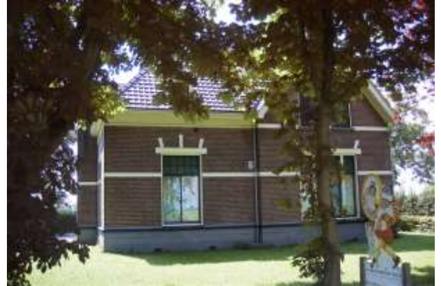
Illustratie: foto's van het Poppenspe(e)lmuseum te Vorchten (ca. 1930/2010).