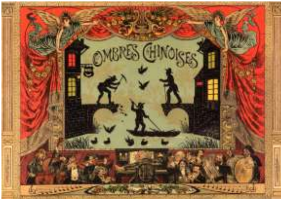
Illustratie: Ombres Chinoises. Frankrijk (1850-1900).

Het museum bezit honderden videobanden, dvd's en dia's. De collectie is in beperkte mate beschreven met behulp van de HVK. Een inventarislijst van de videobanden is beschikbaar (categorie B en C).