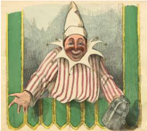
Illustratie: Hanswurst als manser. Kasperltheater. Duitsland (ca. 1800).

N.B. Genoemde bedragen zijn exclusief BTW.